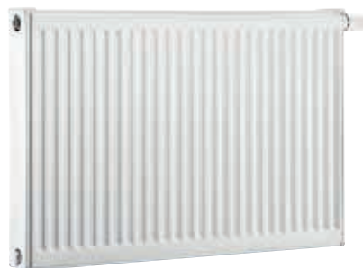
Logatrend C-Profil Logatrend VC-Profil