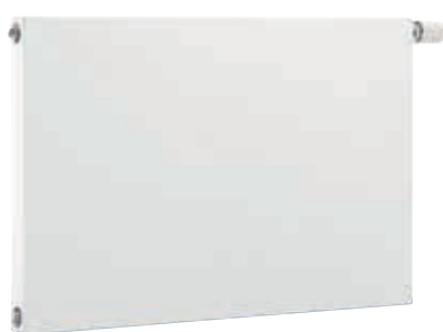
Logatrend C-Plan Logatrend VC-Plan